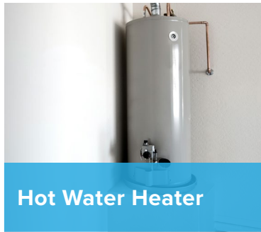
Hot Water Heater