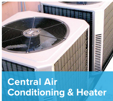
Central Air Conditioning & Heater