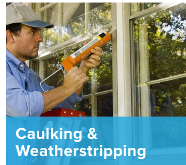
Caulking & Weatherstripping

Your home may be eligible for 1 or more of these options. Talk to your contractor.